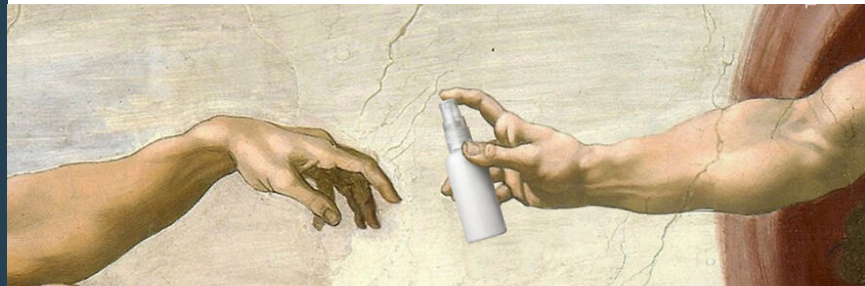
Looma Agency, Kiev

Abbiamo raccolto buone pratiche sviluppate nei paesi europei partner del progetto per agevolare l'inclusione sociale e l'integrazione di rifugiati e migranti. Potete leggere l'ebook sulla pagina facebook del progetto e sul sito dei partner.